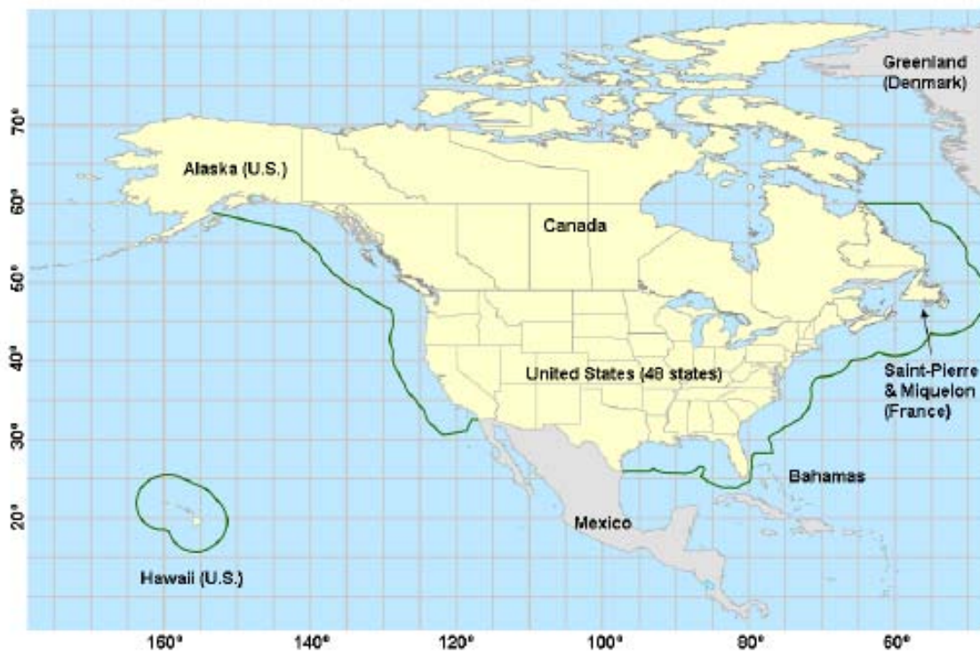
Khu vực kiểm soát phát thải bắc Mỹ