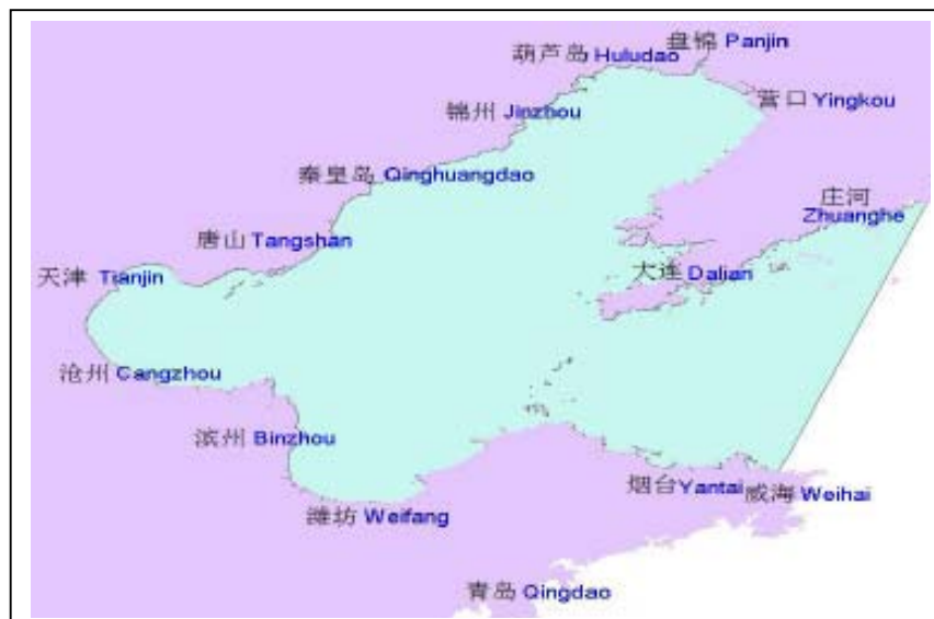
Hình 3: Khu vực kiểm soát phát thải Vùng nước Bột Hải