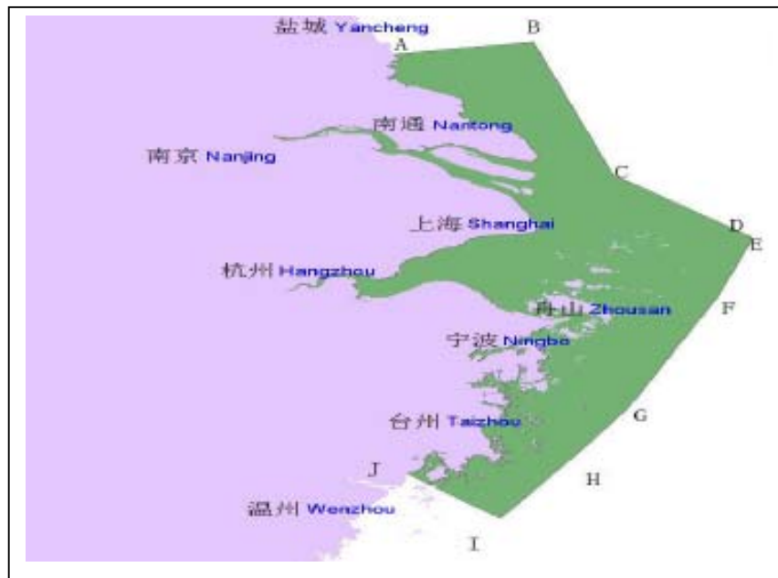
Hình 2: Khu vực kiểm soát phát thải Đồng bằng sông Dương Tử