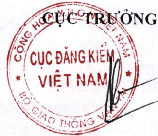
Trần Kỳ Hình